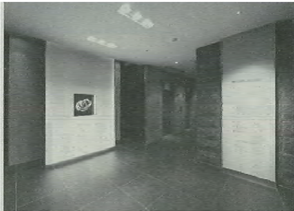
▲「日総第8ビル」のエントランス風景